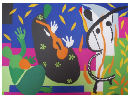
Henri MATISSE « La tristesse d'un roi », 1952

HASARD : compression des matériaux dans une boîte