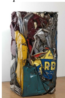
CESAR « Compression « Ricard » », 1962

HASARD : compression des matériaux dans une boîte