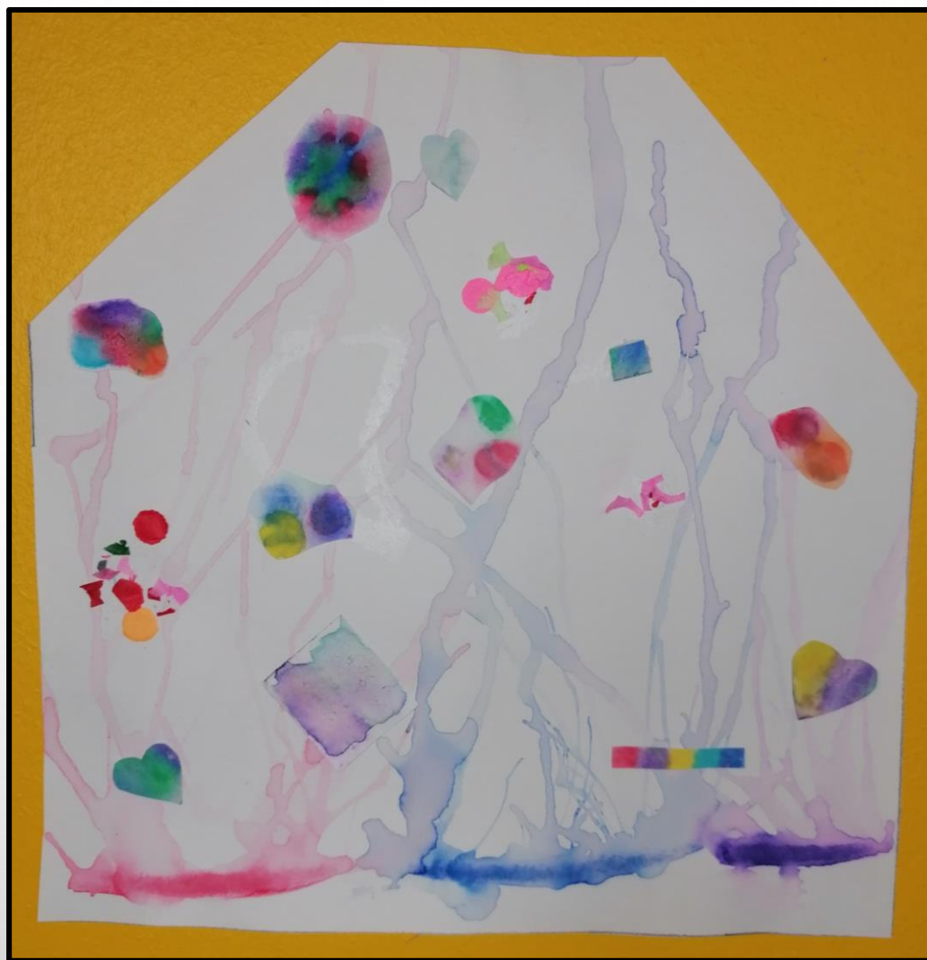
La fontaine de couleur